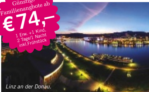
Linz an der Donau.

Günstige Familienangebote ab €74,- 1 Erw. +1 Kind, 2 Tage/1 Nacht inkl. Frühstück